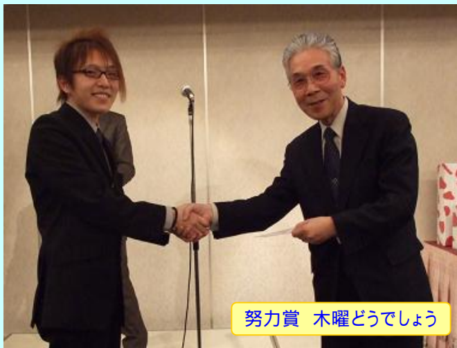
努力賞 木曜どうでしょう