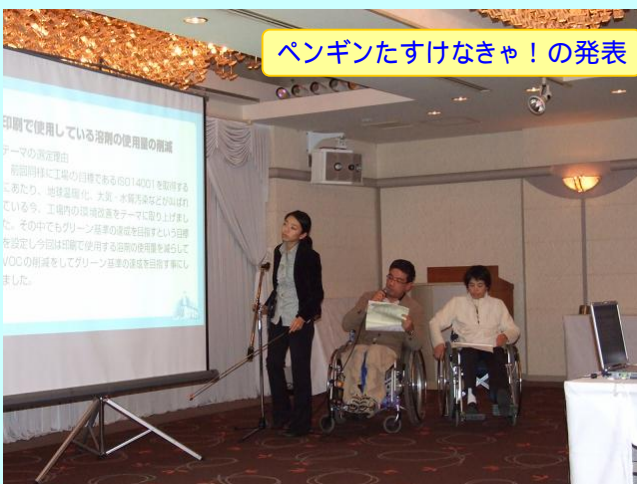
ペンギンたすけなきゃ!の発表