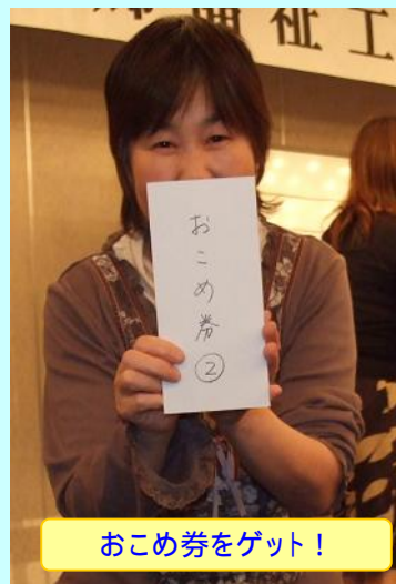
おこめ券をゲット!